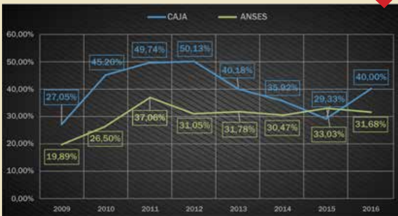
COMPARATIVO DE PORCENTAJES DE AUMENTO ANUALES

En ambos gráficos se puede percibir que la institución ha brindado mayores respuestas previsionales que el organismo nacional durante los últimos 7 años. Si bien en 2015 se dio una baja en los montos de aumento, esto ha sido excepcional ya que mes a mes se consideraron los requerimientos de nuestros beneficiarios, teniendo en cuenta la realidad que se atraviesa. Los datos que se brindaron aquí tienen el objetivo de seguir mostrando la repercusión de las acciones que lleva adelante Caja de ingeniería.