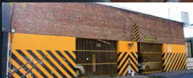
25 de Mayo 2171/2177

cargo, el asociado debe acercarse a la cochera elegida con la Credencial de Caja y Mutual Ingeniería, en la cual consta su afiliación en AMACI. Si aún no cuenta con el nuevo carnet de Caja y Mutual, lo invitamos a realizarlo en sede Santa Fe o delegaciones del interior de la provincia.