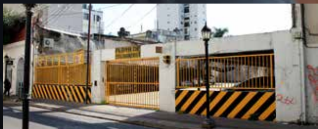
San Martín 1743-57