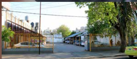
Obispo Gelabert 2441