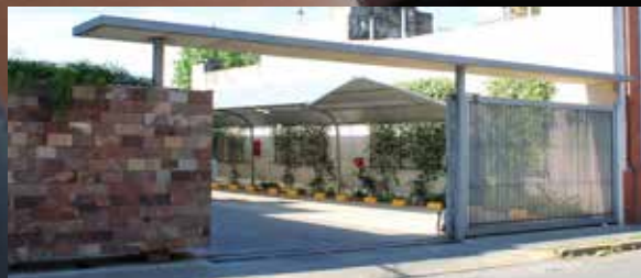
Crespo 2770, 14 a 20 hs.

Para más información o por alquileres mensuales puede comunicarse de lunes a viernes de 8 a 16 hs. a 0342-4521779 int, 184 ó a administracion@mutualingenieria.org